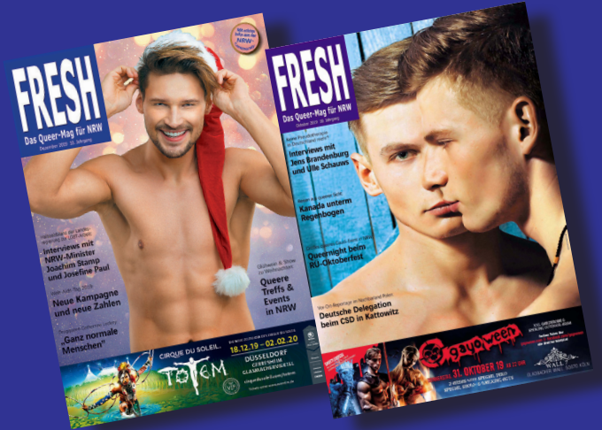
das Queer-Mag für NRW